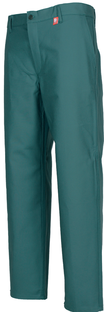
Vert US 04

Braguette 3 boutons • Ceinture fermée par un bouton, 5 passants • 2 poches italiennes • 1 poche mètre sur la jambe droite • 1 poche dos côté droit fermée par un bouton • Entrejambe 80 cm.